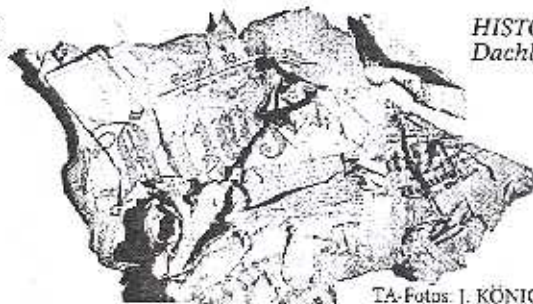
HISTORISCH: Fundstück vom Dachboden – Zeitung von 1914.